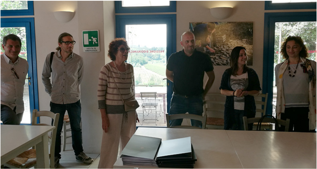
Incontro con i Vignaioli di San Miniato

La domanda più semplice, immediata e ripetitiva è stata: Qual è veramente, nella sostanza, l'identità, l'offerta pisana?